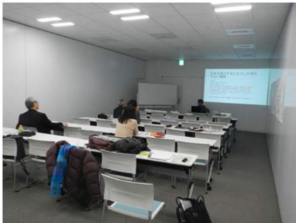
プレゼンテーション風景