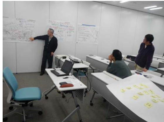
ワークショップ風景（初日・左、2日目・右）